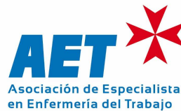
Asociación de Especialistas en Enfermería del Trabajo