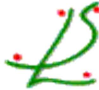
Sociedad Española de Salud Laboral en las Administraciones Públicas